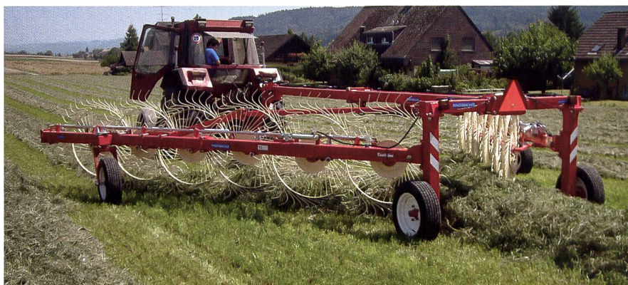
In der Schweiz sind 40 Tonutti-Sternradschwader im Einsatz. Angeboten wird neu auch ein Modell von Enorossi.