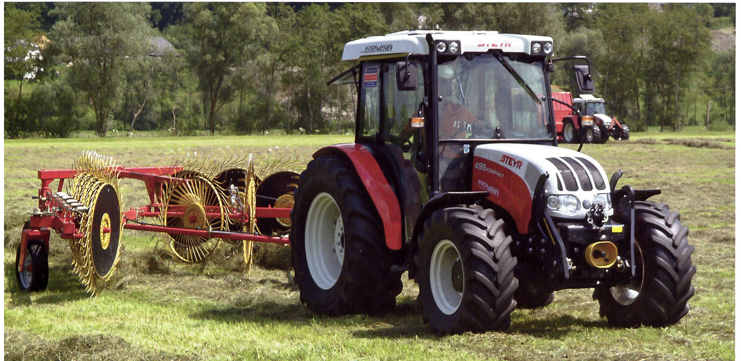
Der Sternradschwader mit Mittelablage schafft auf ebenen Flächen mit geringem Zugleistungsbedarf eine hohe Flächenleistung. Die Schwade wurden luftig und locker abgelegt.