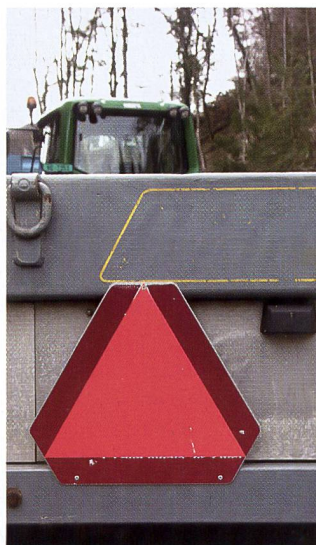
Rot, dreieckig, reflektierend. Das Zeichen für ein Gefährt bis V max 45 km/h