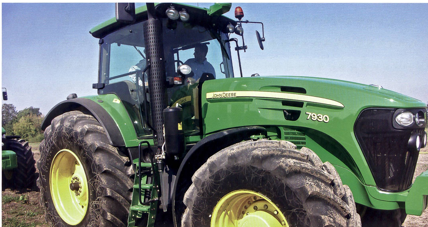
Traktoren dieser Grössenklasse, in deren Fahrzeugausweis die Ziffer 500 eingetragen ist, brauchen keine Seitenblickspiegel.