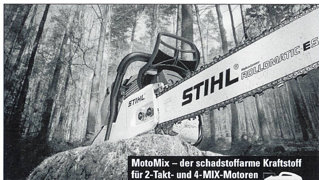
MotoMix – der schadstoffarme Kraftstoff für 2-Takt- und 4-MIX-Motoren