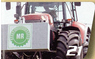
Betriebswirtschaft Gemeinsam nutzen