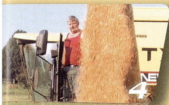
LT extra Mähdrescher