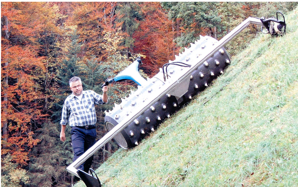
Alles rund ums Mähen zeigt eine Sonderschau an der 6. Tier&Technik.