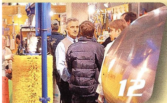
Messehinweis Tier + Technik, Agrimesse Thun