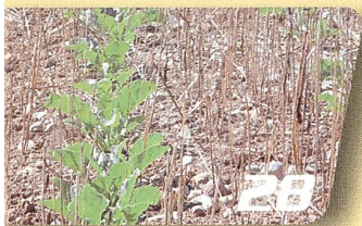
Feldtechnik Zuckerrübe: Saatbett und Sätechnik

Titelbild: Greiferkrananlagen in Altbauten bedingen in aller Regel die Verstärkung der Holzkonstruktion.