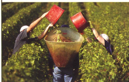
Zu Gast an der OLMA: Der Kanton Genf und seine Landwirtschaft

638 Aussteller (Vorjahr 630) und 27 Sonderschauen belegen 25 685 m 2 Nettostandfläche. Der Gastkanton Genf ist mit der Sonderschau «Genf, der grosse Marktplatz» an der OLMA präsent.