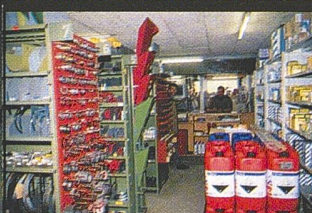
Kostenstruktur und Leistungen