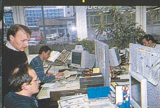
Paul Forrer AG