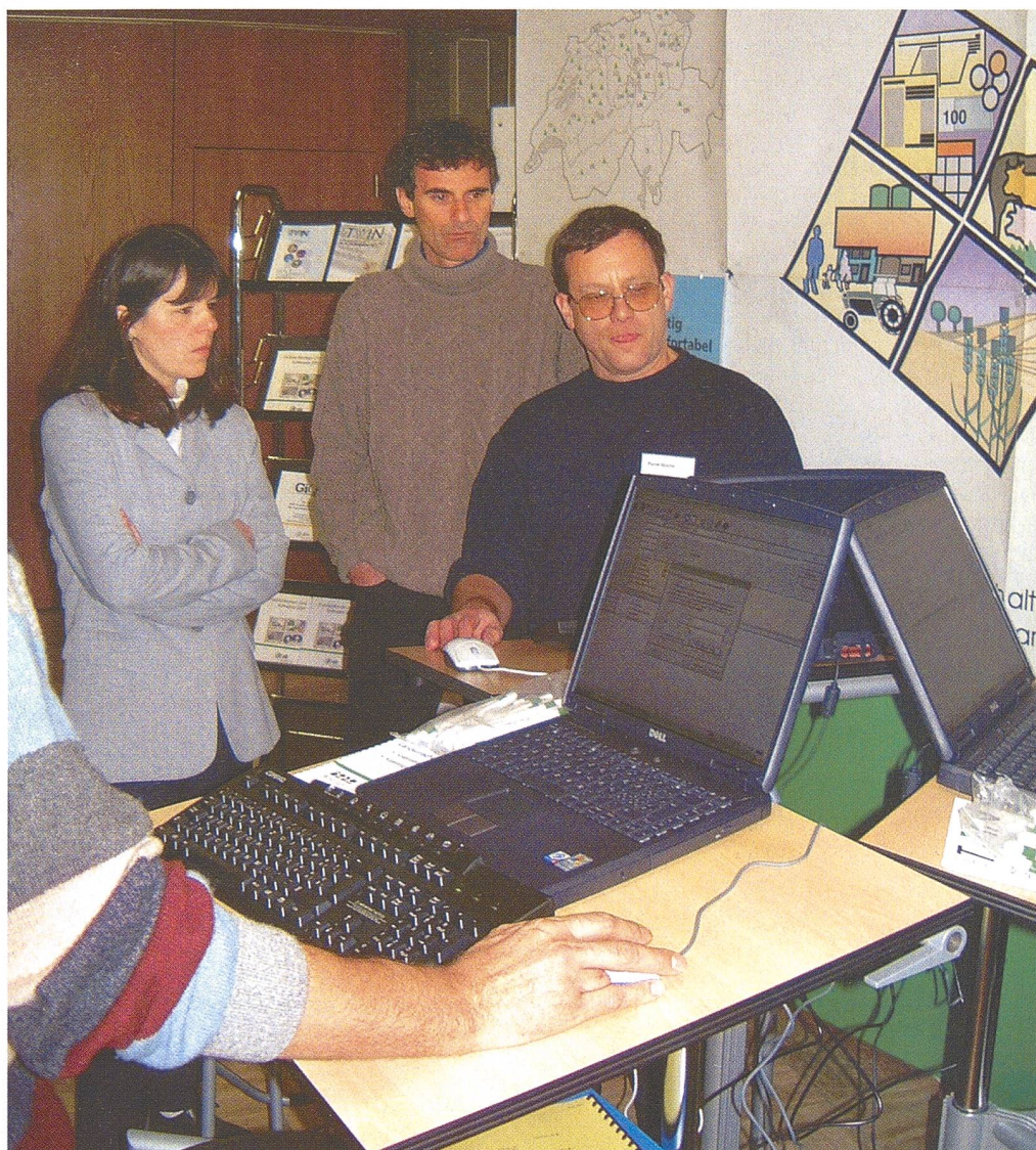
Zehn Soft- und Hardware-Anbieter sind an der INFOLA am Strickhof Lindau mit ihrer Programmpalette vertreten und bieten einen umfassenden Überblick

tels Software) Produktionsdaten gesammelt und ausgewertet werden. Diese Auswertungen dienen den Produzenten, um verschiedene Produktionsmethoden bezüglich Ertrag, Produktionskosten usw. miteinander vergleichen zu können.