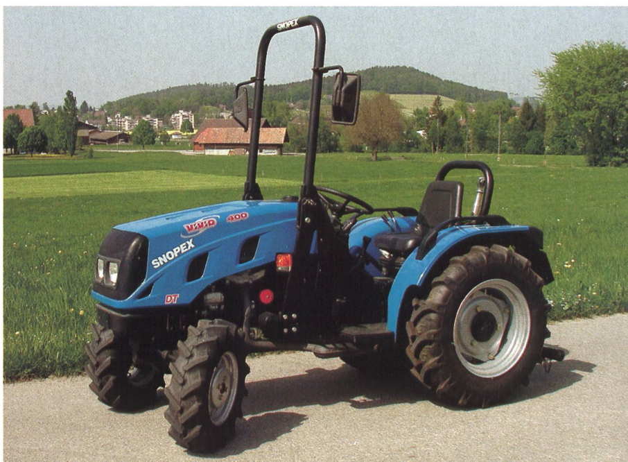
Traktor BCS Vivid 400 DT, 4-Zylinder-Saugmotor mit 25.5 kW (35PS), unsynchronisiertes Wendegetriebe, Gewicht 960 kg, (Listenpreis CHF 29 907.–), Testbericht Nr. 1857/03.

nikon und in Österreich der Bundesanstalt für Landtechnik (BLT) in Wieselburg. Die Testergebnisse der geprüften Mähtraktoren oder Transporter werden, sofern am Fahrzeug keine Änderungen vorliegen, gegenseitig von der anderen Prüfstelle übernommen und unter Quellenangabe in deren Publikationen veröffentlicht. In den Tabellen 4 – Zweiachsmäher und Mähtraktoren – und 5 – Transporter – sind die wichtigsten Testergebnisse zusammen mit der für die Prüfung massgebenden Prüfstelle (FAT oder BLT) und der entsprechenden Testberichtsnummer aufgeführt.