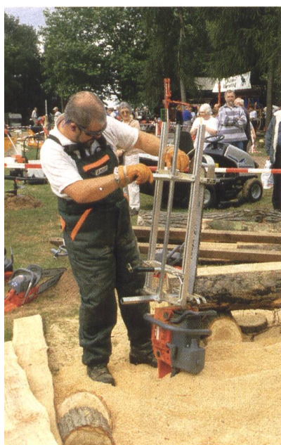
Viele Maschinen können auf dem Freigelände im Einsatz gesehen werden.

Die EDV-Produkte Pcion, Forst-Admin und WinRobin erleichtern die administrative Arbeit und leisten bei der Führung des Forstbetriebs wertvolle Dienste. Über Neuentwicklungen dieser Programme wird am Stand informiert.