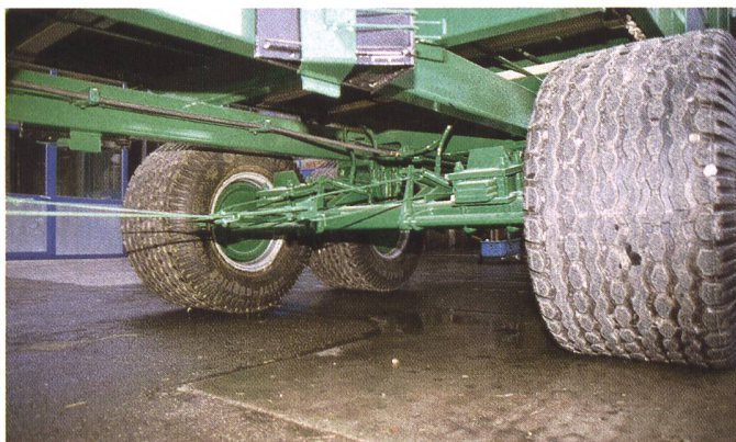
Tandem-Fahrwerk mit Blattfederung Typ «Boggie»: Die komplementäre Vertikalbewegung von vorderer und hinterer Achse des Tandems gleicht Bodenunebenheiten über die gelenkige Fixation des Fahrwerks am Chassis aus.

rungen an Strassenfahrzeuge (VTS) eine maximale Achslast von 16 000 kg. Für das zulässige maximale Gesamtgewicht darf noch die vom Hersteller des Anhängers garantierte Stützlast addiert werden.