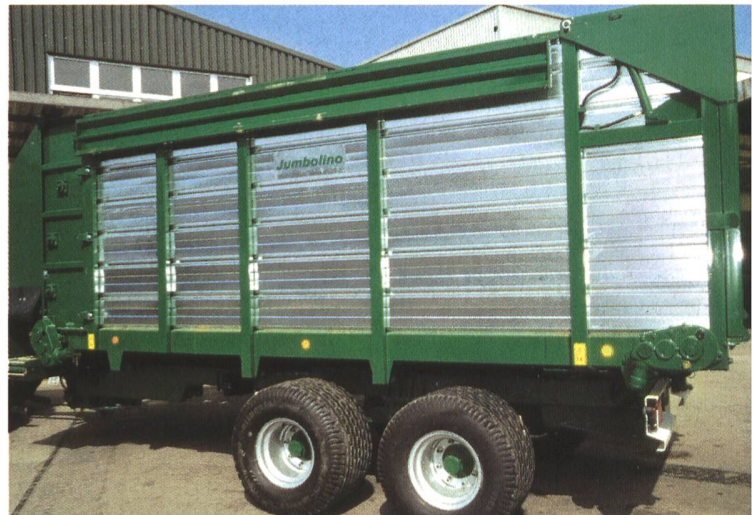
...«seinen» neuen Dosierwagen.

Die Montage des TÜV-geprüften Boggie-Tandem-Fahrwerks am Chassis ist auf zwei Positionen möglich. Damit kann das Gewicht optimal auf die Belastung von Achsen und Deichsel verteilt werden. Ein Bremszylinder wirkt auf