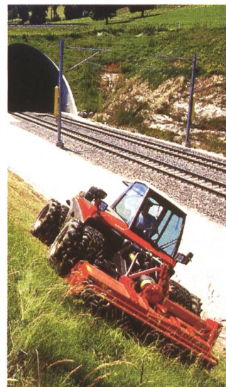
Neu: Hang-Geräteträger Terratrak Aebi TT270.

Aebi Burgdorf bietet für den Bedarf in der Areal-, Grasland- und Grünflächenpflege, in Kommunen, im Garten-/Landschaftsbau, in Bau-/Werkhöfen und Berg-/Skistationen eine sehr breite Palette an multifunktionalen, qualitativ und technisch führenden Arbeitsfahrzeugen, Geräten sowie entsprechende Systemlösungen an.