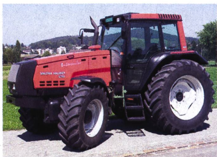
Abb. 6: Traktor VALTRA VALMET 8350-4 HiTech, 6-Zylinder-Turbomotor, 99 kW (135 PS), 3-Stufen-Lastschaltgetriebe, Vorderachsfederung, Gewicht 5720 kg, (Listenpreis Fr. 120 200.-), Traktortest-Nr. 1830/01.