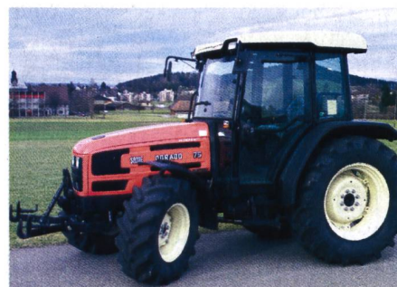
Abb. 7: Traktor SAME Dorado 75, 4-Zylinder-Saugmotor mit 53 kW (72 PS), 3-Stufen-Lastschaltgetriebe, Fronthydraulik und Frontzapfwelle, Gewicht 3110 kg, (Listenpreis Fr. 73 100.-), Traktortest-Nr. 1835/02.