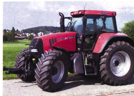
Abb. 3: Traktor CASE IH CVX 150, 6-Zylinder-Turbomotor, 107 kW (145 PS), stufenloses Fahrgetriebe mit drei Fahrbereichen, Fronthydraulik, Vorderachsfederung, Kabinenfederung, Gewicht 7150 kg, (Listenpreis Fr. 162 600.-), Traktortest-Nr. 1844/02.