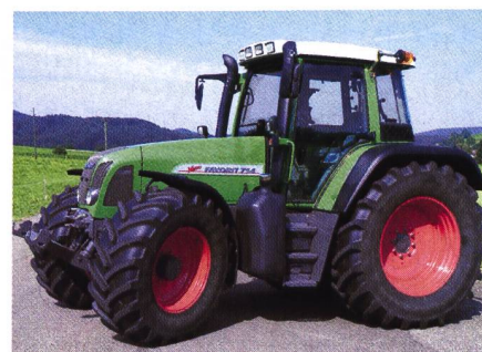
Abb. 1: Traktor FENDT Favorit 714 Vario, 6-Zylinder-Turbomotor mit 4-Ventil-Technik und Ladeluftkühlung, 103 kW (140 PS), stufenloses Fahrgetriebe mit zwei Fahrbereichen, Fronthydraulik und Frontzapfwelle, Vorderachsfederung, Kabinenfederung, Gewicht 6500 kg, (Listenpreis Fr. 170 388.-), Traktortest-Nr. 1829/01.