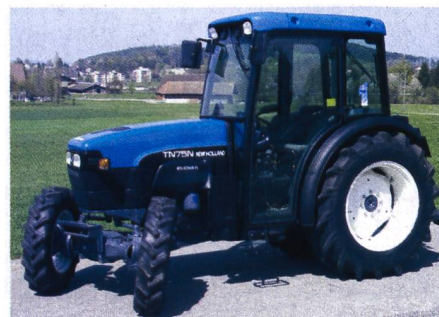
Abb. 9: Schmalspurtraktor NEW HOLLAND TN75 N, 3-Zylinder-Turbomotor mit 53 kW (72 PS), 2-Stufen-Lastschaltgetriebe, Trakturvorderachse SuperSteer, Gewicht 2530 kg, (Listenpreis Fr. 66 280.-), Traktortest-Nr. 1838/02.