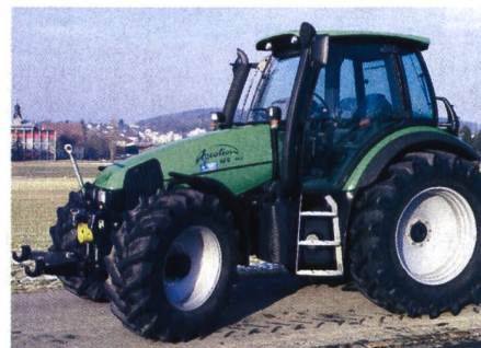
Abb. 5: Traktor DEUTZ-FAHR Agrotion 120 MK3, 6-Zylinder-Turbomotor, 92 kW (125 PS), 4-Stufen-Lastschaltgetriebe, Fronthydraulik und Frontzapfwelle, Vorderachsfederung, Gewicht 6280 kg, (Listenpreis Fr. 124 700.-), Traktortest-Nr. 1836/02.

Der Druck der Konkurrenz zwingt auch die namhaften Maschinenhersteller zur intensiven Zusammenarbeit oder zu Zusammenschlüssen. Unter verschiedenen Namen erscheinen deshalb Traktorenmarken für zum Teil identische Produkte. Lediglich die Farbgebung oder gewisse Komfortausstattungen sind unterschiedlich. Mit einer Ausnahme (Fendt 250S) sind alle in der Liste aufgeführten Traktoren mit Allrad ausgerüstet. Der Allradantrieb erhöht nebst der Zugkraft und der Bremswirkung unter anderem auch die Sicherheit eines Traktors in Hanglagen, insbesondere in Kombination mit grösserer Spurweite.