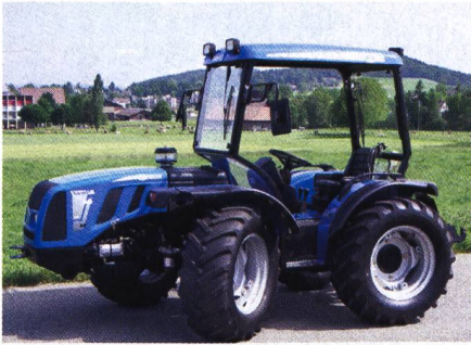
Abb. 10: Zweiwegtraktor BCS Vitthar 900 MT, 4-Zylinder-Turbomotor, mit 61 kW (83 PS), synchronisiertes Wendegetriebe, Gewicht 2050 kg, (Listenpreis Fr. 66 497.-), Traktortest-Nr. 1842/02.