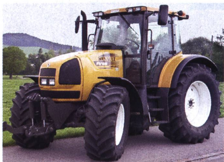
Abb. 4: Traktor RENAULT Ares 696 RZ, 6-Zylinder-Turbomotor, 104 kW (140 PS), 4-Stufen-Lastschaltgetriebe, Fronthydraulik, Vorderachsfederung, Kabinenfederung, Gewicht 6400 kg, (Listenpreis Fr. 126 423.-), Traktortest-Nr. 1834/02.