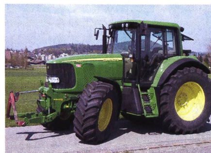
Abb. 2: Traktor JOHN DEERE 6920 AutoPowr, 6-Zylinder-Turbomotor mit Ladeluftkühlung, 110 kW (150 PS), stufenloses Fahrgetriebe, Fronthydraulik und Frontzapfwelle, Vorderachsfederung, Kabinenfederung, Gewicht 6840 kg, (Listenpreis Fr. 171 850.-), Traktortest-Nr. 1843/02.