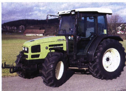
Abb. 8: Traktor HÜRLIMANN XA 658, 4-Zylinder-Turbomotor, mit 61 kW (83 PS), 3-Stufen-Lastschaltgetriebe, Fronthydraulik und Frontzapfwelle, Gewicht 3300 kg, (Listenpreis Fr. 79 400.-), Traktortest-Nr. 1837/02.

Zweiachsmäher, Mähtraktoren und Transporter sind Maschinen, die spezifisch im Hang- und Berggebiet in der Schweiz und Österreich zum Einsatz gelangen. Folglich haben sich sowohl deren Herstellung als auch Prüfung vor allem in diesen beiden Ländern etabliert. Die technische Prüfung dieser Spezialmaschinen obliegt in der Schweiz der FAT in Tänikon und in Österreich der Bundesanstalt für Landtechnik (BLT) in Wieselburg. Die Testergebnisse der geprüften Mähtraktoren oder Transporter werden, sofern am Fahrzeug keine Änderungen vorliegen, gegenseitig von der anderen Prüfstelle übernommen und unter Quellenangabe in deren Publikationen veröffentlicht. In den Tabellen 4 – Zweiachsmäher und Mähtraktoren – und 5 – Transporter – sind die wichtigsten Testergebnisse zusammen mit der für die Prüfung massgebenden Prüfstelle (FAT oder BLT) und der entsprechenden Testberichtsnummer aufgeführt. Die ausführlichen Testberichte sind bei der jeweiligen Prüfstelle (siehe Testbericht-Nr.) oder beim Maschinenhersteller bzw. Schweizer Importeur erhältlich. Die genauen Anschriften der Prüfstellen finden sich am Schluss dieses Berichts.