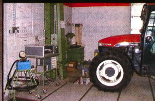
Neu geprüfte Traktoren