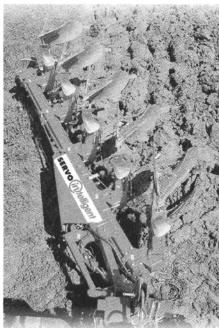
Schweizer Premiere für den elektronischen Pflug von Pöttinger.

bestaunen. Beispielsweise sind der Hochleistungs-Schneidspalter SPK 301 und der HydroCombi 22t Turbo (Europas schnellster Meterspalter!) von Posch erstmals ausgestellt.