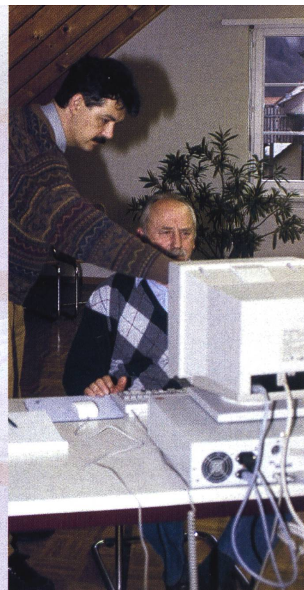
Lernerfolg dank kleiner Gruppe und kompetenter Kursleitung. Anmeldung für Werkstatt- und/oder EDV-Kurse.