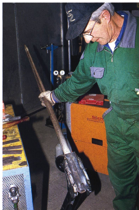
Vergleich und Know-how in der Anwendung von modernen Schweissapparaten.