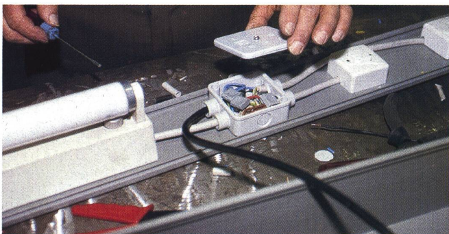
Sichere Installation von elektrischen Anlagen.