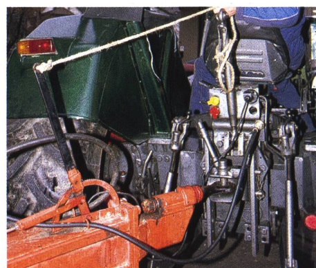
Werterhaltung gross geschrieben