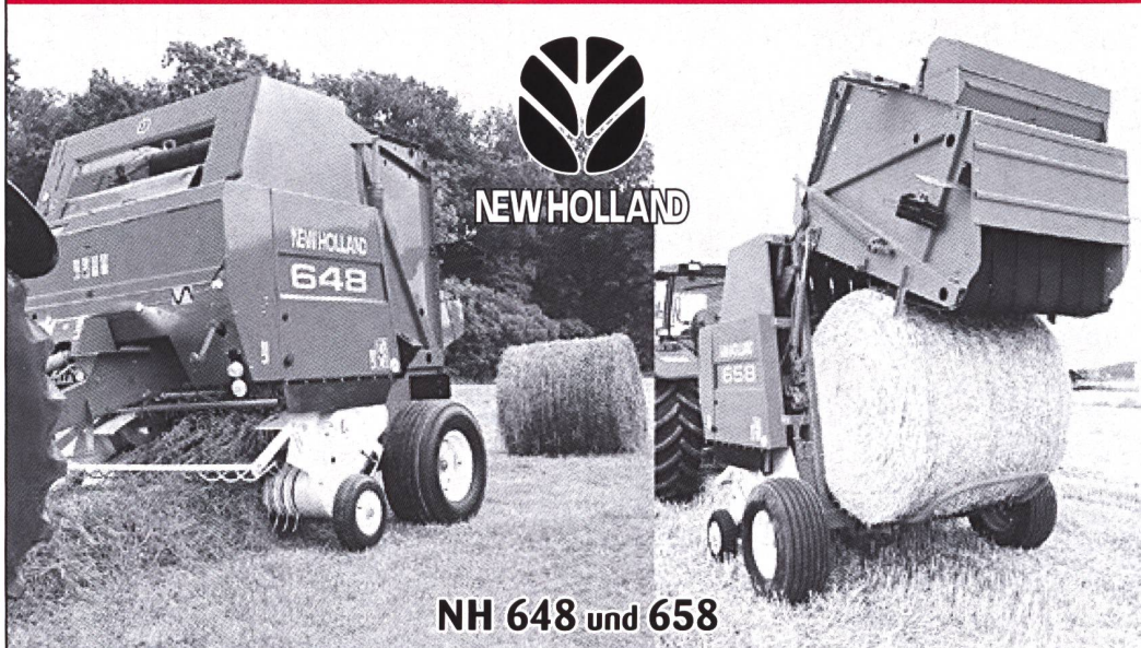
NH 648 und 658

Die bewährten variablen Runden, mit hoher Schnittqualität und kleinem Unterhalt