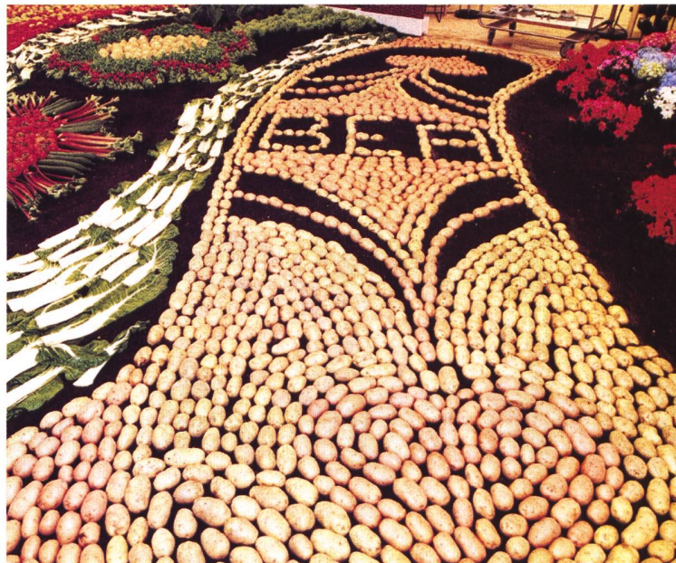
Qualitätsprodukte der Schweizer Landwirtschaft.

BEA/PFERD, BEA bern expo, Tel. 031 340 11 49 Internet: www.beapferd.ch