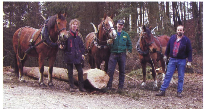
Rosse und Besitzer harmonisieren miteinander.