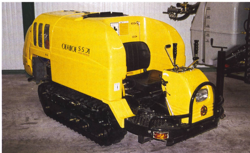
Die neue Generation selbstfahrender Sprayer der SILENT Speed Sprayer mit einem Tankinhalt von 400 Liter.

die Bearbeitung von Steillagen im Weinbau und wiederum für den Einsatz im kommunalen Bereich. Neu findet man eine neue Generation Raupenfahrzeug für den Pflanzenschutz. Dieses sehr kompakt gebaute SILENT-Speed-Sprayer-Fahrzeug ist 90 cm breit, 580 kg schwer und wird von einem 20-PS-Motor angetrieben. Er ist mit 4 Vorwärts- und 2 Rückwärts- gängen ausgestattet und verfügt über einen Tankinhalt von 400 Liter. Im Angebot wird zudem ein umfassendes Reinigungstechnikprogramm vertrieben. ■