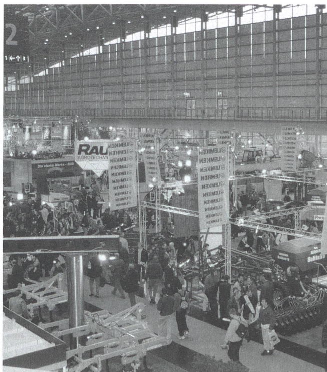
Agritechnica: Das vollständigste Landtechnikangebot in modernsten Hallen.