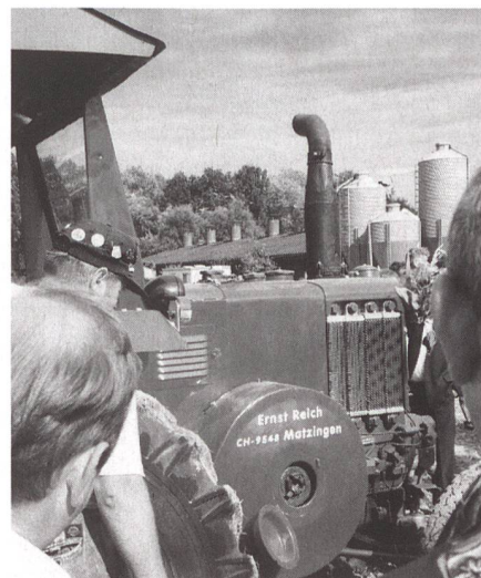
Andächtiges Lauschen auf das Pochen des Kolbenmotors.