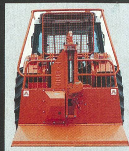
Sicheres und kraftvolles Holzbringen in jedem Gelände

Sie sitzen komfortabel und rundum optimal geschützt im STEYR Forstraktor. Mit der Seilwinde ziehen sie die Baumstämme kraftvoll zum Verladeplatz, wo sie dann mit dem Kran auf den Forst-Trailer verladen werden. STEYR bietet ein abgerundetes Forstprogramm mit RME-tauglichen Motoren von 68-150 PS / 50-110 kW. Wendigkeit, Komfort und Sicherheit zeichnen diese höchst funktionellen Profi-Traktoren im täglichen harten Einsatz aus. Testen Sie Ihren STEYR Forstraktor selbst, Ihr STEYR-Partner erwartet Sie!