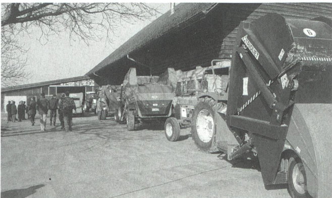
Die Maschinendemonstration zeigte einen sehr repräsentativen Querschnitt durch das Angebot.