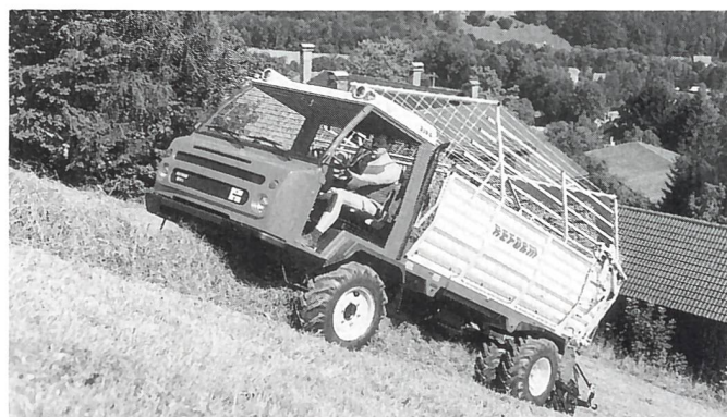
Der neue Power-Muli 575 G/SL mit Vielschnittladewagen.

AGROMONT AG, Hünenberg, REFORM-Generalvertretung, 6343 Rotkreuz