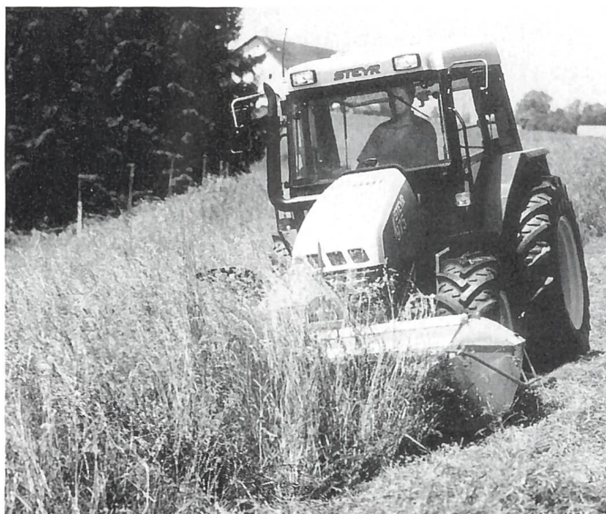
Steyr-Multi-Trac im Mäheinsatz.

In der Praxis haben sich die kraftvollen 3-Zylinder-Turbo-Dieselmotoren mit Drehmomentanstieg von bis zu 30% bestens bewährt. Sie verleihen den Steyr-Multi-Trac Durchzugskraft und hohe Elastizität über einen grossen Drehzahlbereich. Das fein abgestufte, vollsynchronisierte Getriebe verfügt über 9 Gänge im Hauptarbeitsbereich von 4 bis 12 km/h. Speziell für den Mäh-/Ladebetrieb sind die Steyr-Multi-Tracs mit einer vierfachen Heckzapfwelle ausgerüstet. Das achsgeführte Fronthubwerk, verbunden mit der elektronischen Geräteentlastung, garantiert auch im schwierigen Gelände einen exakten