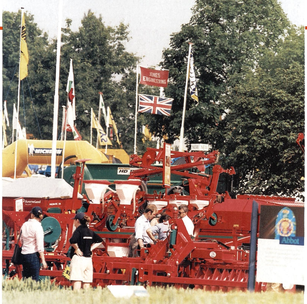
Royal Show: 100 ha Freigelände für Tierzucht, Pflanzenbau und neuste Technik, garniert mit vielen Attraktionen und Vorführungen.

Bei Abmeldungen nach dem Versand der Rechnung und der Bestätigung (diese erfolgt in der Regel nach dem