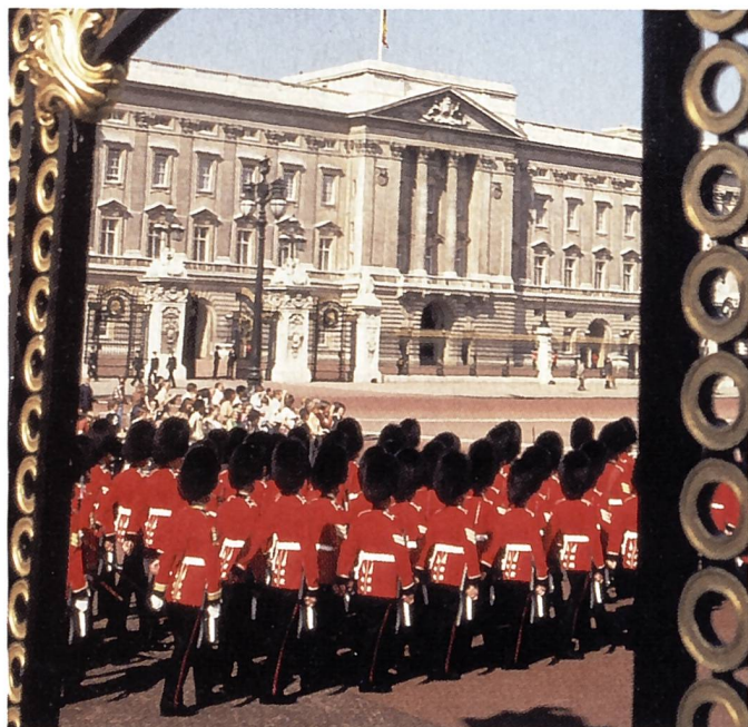
Wachablösung beim Buckingham-Palast.

Die Royal International Agricultural Show im englischen Stoneleigh/Warwickshire ist die umfassendste jährliche Landwirtschafts-Ausstellung der Welt. Sie findet auf einem speziell dafür angelegten 100 Hektaren grossen Gelände statt und bietet die einzigartige Gelegenheit, an einem Ort die neusten landwirtschaftlichen Maschinen, Einrichtungen und Forschungsarbeiten, unter anderem auch im Rahmen von Zuchtviehvorführungen, Maschinendemonstrationen und vielen Sonder-schauen, zu sehen.