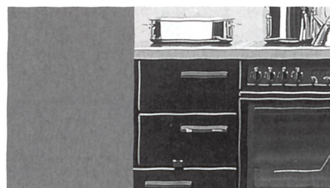
Holzherde und Kombiherde