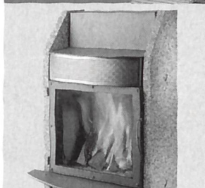
Cheminéeöfen von 6 bis 12 kW