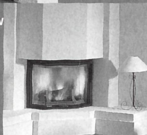
Cheminées, Einsätze und Heizkassetten

Mehr Infos finden Sie im Internet unter: www.tiba.ch