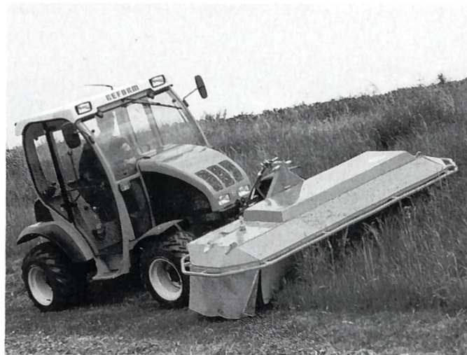
Die neue Reform: Mounty mit Scheibenmäbwerk 2,40 m.

Im Mittelpunkt stand der neue Bergtraktor Mounty mit vier gleichgrossen Rädern, einer modisch auf geschwungene Linien achtenden Kabine und Motorhaube. Das verblüffende Gefährt, das sich punkto Hangtauglichkeit zwischen einem typischen Zweiaxsmäher und einem Normaltraktor einordnet, ist eine wirkliche Novität, die sich punkto Hangtauglichkeit zwischen dem Zweiaxsmäher und dem Normaltraktor des Graslandes einreicht. Der Traktor verfügt über alle Lenkungsmöglichkeiten eines Spezialfahrzeuges (Vorderachslenkung, Hinterachslenkung, Hinter- und Vorderachslenkung sowie Hundegang), und diese Lenkungsarten können sogar während des Fahrbetriebs geschaltet werden. Der Mounty verfügt über einen 4-Zylinder-Dieselmotor mit 46,3 kW/63 PS Leistung und einen Drehmomentanstieg von 22 %.