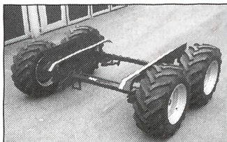
Kurmann-Bogie Tandemaggregat für Tiefgang-Ladewagen und spez. Anhänger, starr oder gelenkt