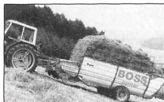
Kurmann-Triebachseinbau zu Pöttinger Ladewagen