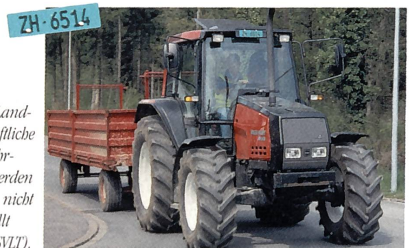
Grün: Landwirtschaftliche Motorfahrzeuge werden der LSV nicht unterstellt.

Das heisst, alle «weiss» eingelösten Motorkarren oder Traktoren sind Schwerverkehrsabgabe pflichtig, unabhängig von der maximal zulässigen Fahrgeschwindigkeit. Unterschied: Fahrzeuge über 30 km/h müssen obligatorisch mit einem Restweg- oder Fahrtschreiber ausgerüstet sein. Dies betrifft alle «weiss» eingelösten Traktoren, die für die Höchstgeschwindigkeit 40 km/h zugelassen sind.