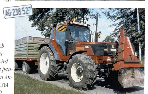
Weiss: Gewerblich eingelöster Traktor wird zu einem pauschalisierten Ansatz der LSV unterstellt.