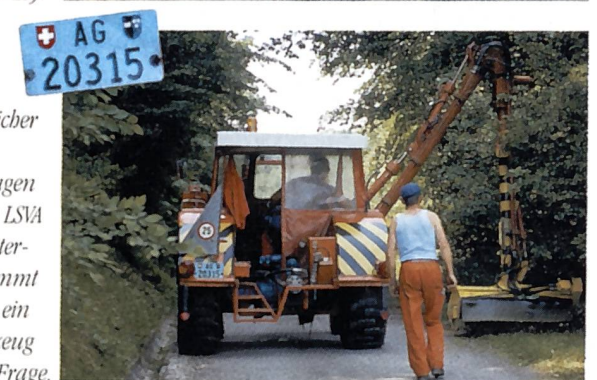
Blau: Gewerblicher Arbeitsmotorwagen wird der LSV nicht unterstellt, kommt aber für ein Zugfahrzeug nicht in Frage.