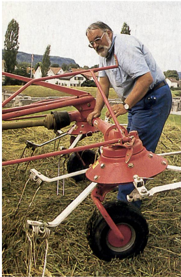
Aargau: Landschaftspflege an antiker Stätte: Amphitheater Vindonissa.