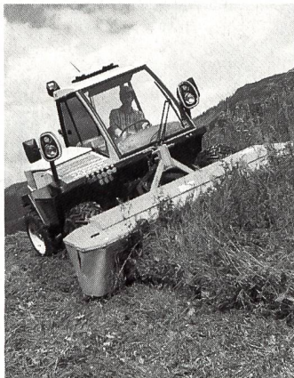
REFORM Metrac H5 mit Scheibenmäherwerk.

und eine hohe Schlagkraft aufweise. Hervorragend positioniert ist auch die Muli-Generation 565 und 555. In der 65-PS-Leistungsklasse habe das Fabrikat in der Schweiz einen Marktanteil von 64 Prozent erzielt, in Österreich sogar von 73 Prozent, heisst es in der Pressemitteilung.