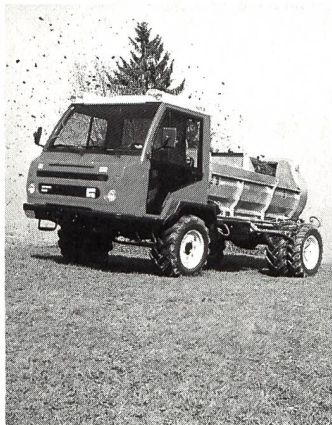
REFORM Muli 565 G mit Gafner-Mistzetter.