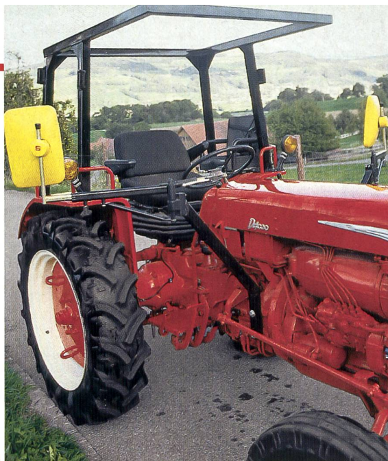
Ein Fahrerschutz kann Leben retten. Mehr als 300 Landwirte wären in den letzten 20 Jahren bei einem Traktorsturz nicht ums Leben gekommen, wenn sie von einer Fahrerschutzvorrichtung geschützt worden wären.

Bedingungen und Fahrbahneigenschaften und beim Testen der Geschwindigkeitsdifferenz zwischen 30 km/h und 40 km/h. Die neue maximale Geschwindigkeit von 40 km/h für landwirtschaftliche Fahrzeuge ist auf dem BUL-Stand selbstverständlich auch generell ein wichtiges Thema. Bei den Profis der Unfallverhütung am BUL-Stand in Halle 1 gibt es auf alle Fälle viele Neuigkeiten und Informationen. Ruedi Burgberr