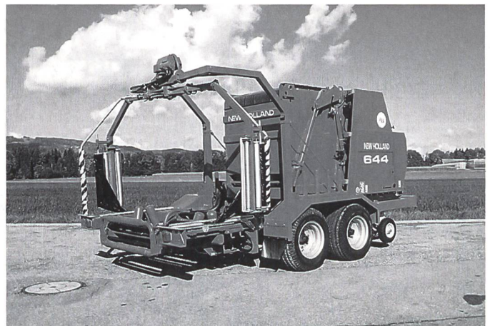
Tawi-Wickler 600 + Rundballenpresse NH 648 (644).