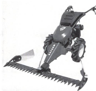
Reform-Bergmäher M7/M8 mit hydrostatischem Fahrtrieb.

Die neue M7/M8-Reihe ist mit hydrostatischem Fahrtrieb und mit 9 und 11 PS Motorleistung ausgestattet. Beide besitzen ein sperrbares Differentialgetriebe für bequemes und sicheres Manövrieren. Der stufenlos regulierbare Fahrtrieb sorgt für optimale Anpassung an unterschiedliche Mäh- und Arbeitsverhältnisse. Die L-Ausführung mit Lenkautomat sichert hohen Arbeitskomfort beim Wenden und Manövrieren auch am Hang.