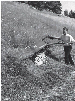
Die neuen Reform-Motormäher M3 mit innovativer Technik und noch mehr Komfort.

Der Reform LK+DK mit zusätzlichen Kriechgängen vorwärts und rückwärts für besonders anspruchsvolle Einsätze.