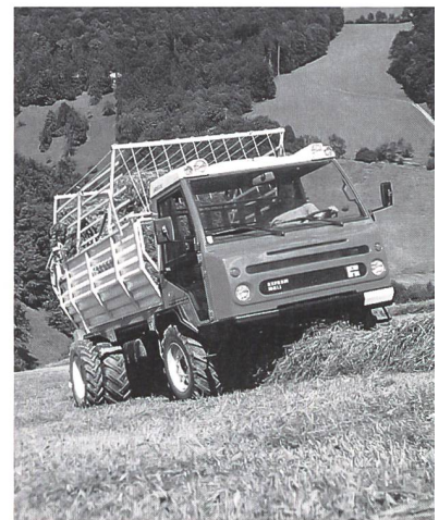
Neuer Vielschnittladewagen Muli 565 G.

– erfüllen die vielfältigen Anforderungen der Praxis. Angefangen vom grösseren Tiefgang der Pick-up über die zweiteilige Ladewagentür, die eine optimale Entleerung auch bei niedrigen Stalldurchfahrten sichert, bis hin zum Ladewagenaufbau mit neuen kunststoffbeschichteten Seitenwänden gibt es eine Vielzahl von Detailverbesserungen: Einhängeösen zum Hochheben des Aufbaues, Dachseile bequem einzeln aushängbar, neues Hecktuch aus stärkerem Material.