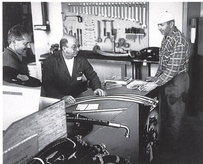
Hydraulik- und Metallschläuche im Sofortservice. 25000 Teile am Lager.

Technische Schläuche und Anschlüsse sind als spezifische Produktgruppe zusammengefasst. Die Vielfalt an Schlauchsorten und Dimensionen widerspiegelt die breiten Bedürfnisse