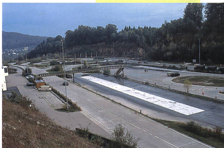
Verkehrssicherheitszentrum Veltheim AG.

Diese vereinbarten Fahrtrainings in Veltheim werden von der Same Deutz-Fahr Schweiz AG in Schwarzenbach SG und Walter Marolf AG in Finsterhennen gesponsert.