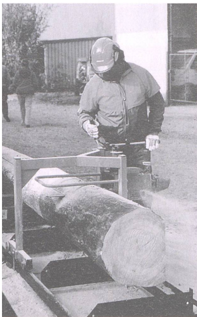
Kleinsägewerk mit Jonsered-Technik bringen mit dem Aspen-Spezialbenzin deutlich weniger Schadstoffe in die Luft.