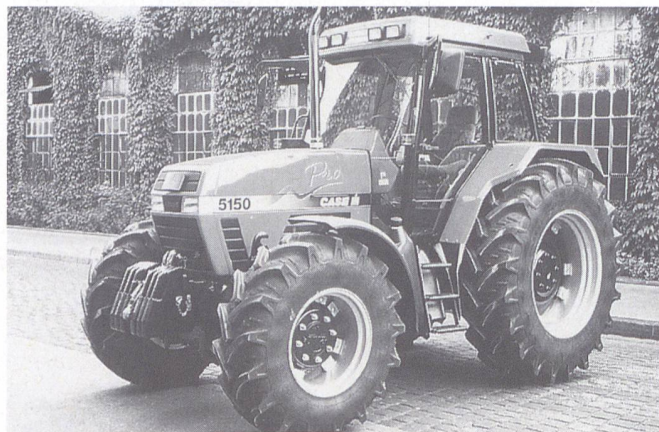
Das Flaggschiff von Case, der Maxxum Pro.