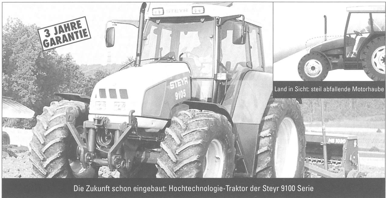
Die Zukunft schon eingebaut: Hochtechnologie-Traktor der Steyr 9100 Serie