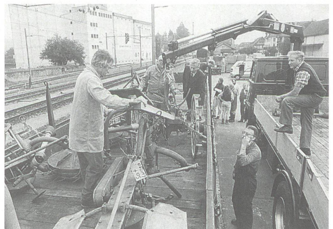
Funktionstüchtige Gebrauchtmachines können in der rumänischen Landwirtschaft wertvolle Dienste leisten. Verlad der Maschinen am Bahnhof in Malters.