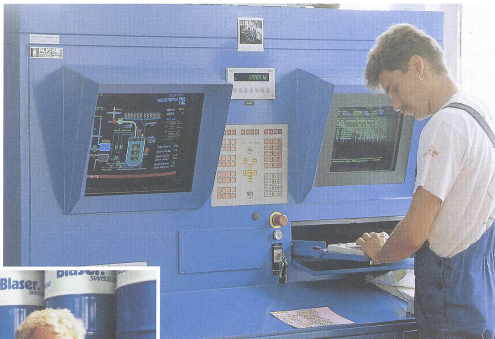
Forschung und innovative Produkte sichern die Wettbewerbsfähigkeit.

S chmierstoffe von Blaser = Zufriedene Kundschaft. Dies ist die Botschaft in der Blaser-Werbung seit vielen Jahren; Blaser Swisslube «ab Hasle-Rüegsau – Rund um die Welt» = Schweizer Qualität in der Herstellung von Schmierstoffen für weltweite Problemlösungen in der Tribologie, die neu dazugekommene. Wir stellen das Unternehmen vor, das mit einem wesentlichen Marktanteil an der Landwirtschaft partizipiert.