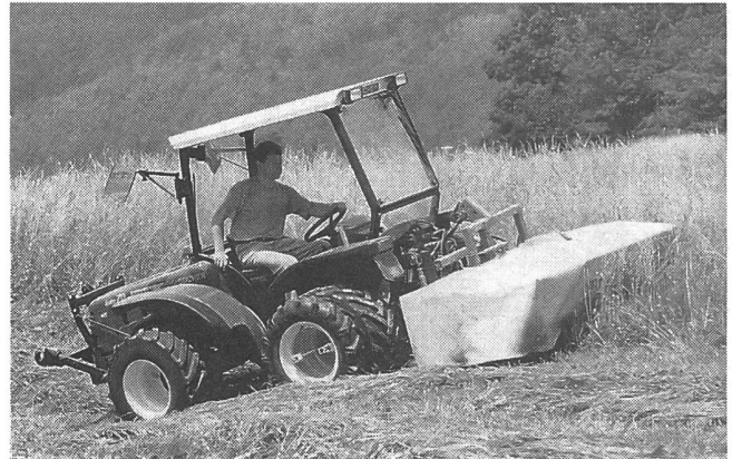
Bucher Ferrari RS 70.

Anfragen an: Bucher Landtechnik AG, Niederweningen