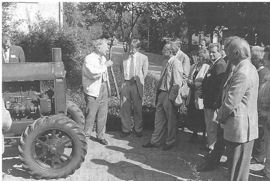
Offizielle Übergabe des IHC 10-20.

Aus Anlass des 25jährigen Bestehens der Rohrer-Marti AG für Land- & Fördertechnik in Dällikon bei Regensdorf durfte das Agrotechnorama Tänikon kürzlich eine Jubiläumsspende entgegennehmen. Das Bild zeigt die offizielle Übergabe eines IHC-Traktors, Typ