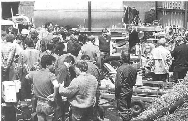
Maschinenvorführungen: Beste Vergleichsmöglichkeiten