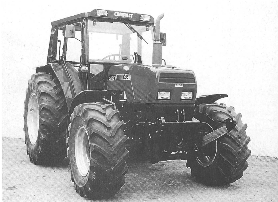
Zu der Compact-Baureihe gehören insgesamt fünf wendige, leichte und leistungsstarke Traktoren.

Die S+L+H-Gruppe erhielt damit die offizielle Anerkennung eines hohen Qualitätsstandards in allen Bereichen.