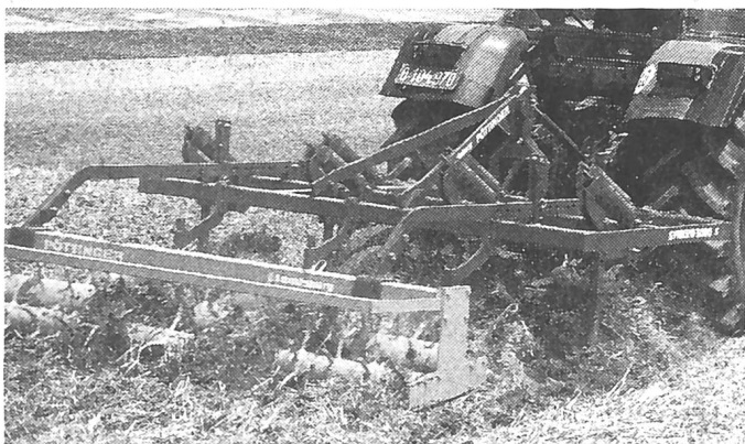
Pöttinger Synkro 3000 macht den Acker in einem Arbeitsgang saatsfertig.

mischen und ebnen vor dem Nachlaufgerät die Bodenoberfläche gleichmässig ein.