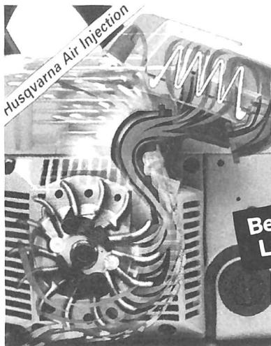
Air Injection... Zentrifugalreinigung.