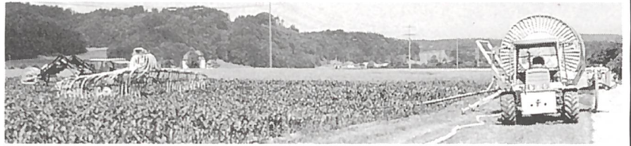
RENO-Beregnungsmaschine im Einsatz für die perfekte Verteilung.

Gülle- und Klärschlamm-Lieferservice/Stefan Galliker, Ruswil, Tel. 041 73 20 45