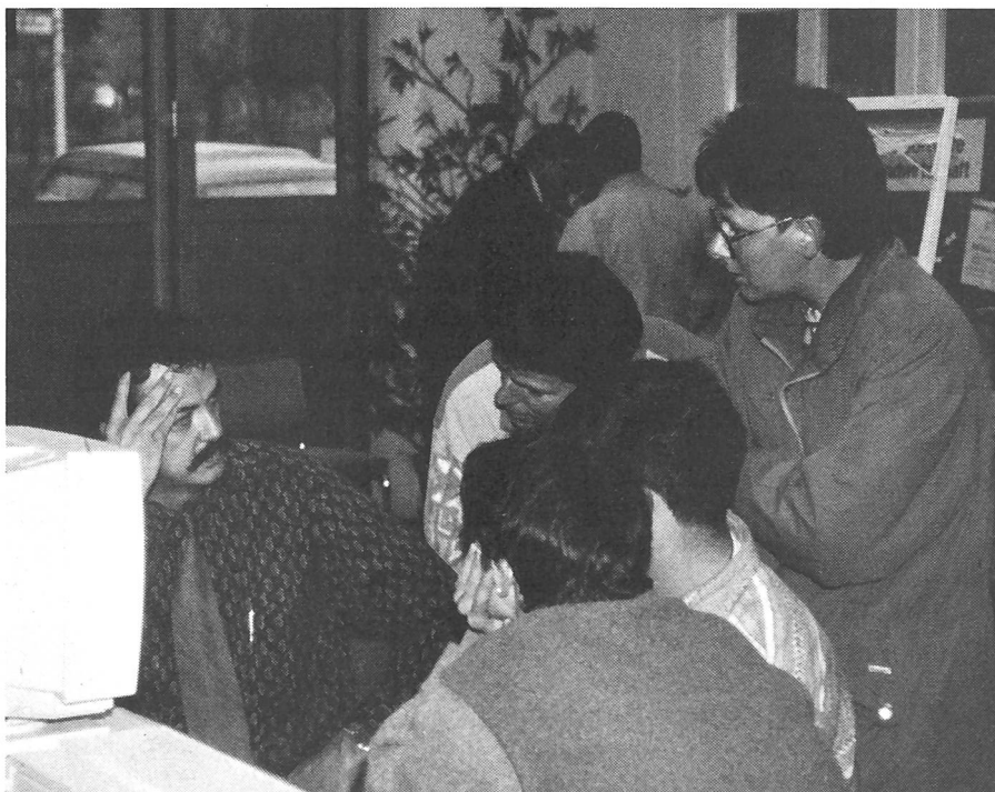
Intensive Kontakte zwischen Kunden und Anbietern prägen das Bild an der INFOLA. Die Formel, die Ausstellung an einem Freitag und einem Samstag durchzuführen, hat sich als günstig erwiesen. Die nächste INFOLA gelangt am 3. und 4. November 1995 zur Durchführung.

dows-unterstützte Programme angeboten werden; nicht so sehr, weil damit entscheidende Vorteile zu erwarten wären, sondern dem allgemeinen Trend folgend, dass Windows je länger je beliebter wird. Dazu kommt, dass schon in manchem Betrieb ein leistungsfähiger Computer der 486er Klasse mit Windows-Programmen steht und läuft.