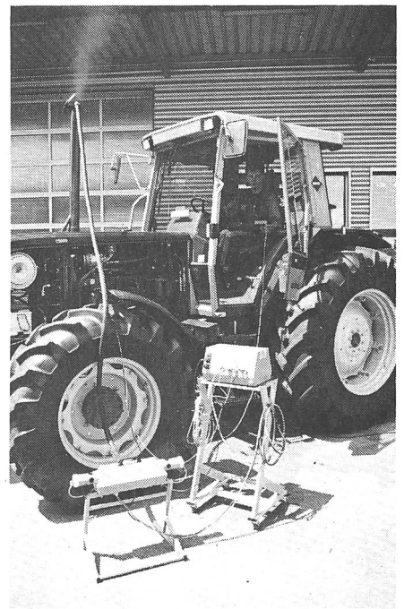
Für eine Zukunft ohne Rauchzeichen – Der homologierte Dieselabgastester Motorex RD 1605.

Beratung wird bei Motorex Toptech seit jeher grossgeschrieben. Neben der komplett ausgerüsteten Diagnoseeinheit, die ein sofortiges Arbeiten an verschiedenen Fahrzeugkategorien ohne den vorgängigen Zukauf von unzähligen Zubehör zulässt, wird auch eine