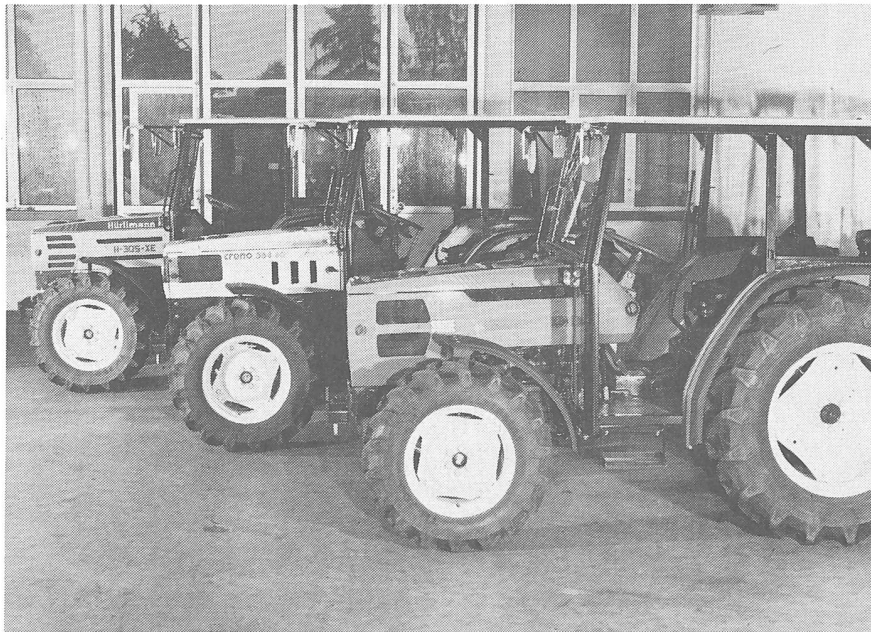
Neue Traktoren mit drei Jahren Garantie von SAME – Hürlimann – Lamborghini in den Klassen 50, 60 und 70 PS.

Die niederen Gesamtgewichte (ab 1865–2280 kg), die guten Leistungsgewichte und die optimale Gewichtsverteilung von 45% vorn und 55% hinten sind die Grundlagen für bodenschonendes Arbeiten.