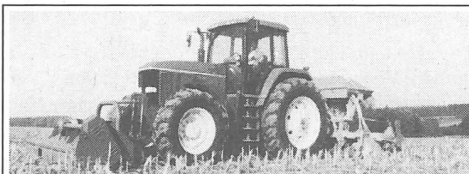
3 neue USA-Traktoren von 130 bis 170 PS