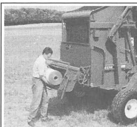
3 Rundballenpressen für den Praktiker