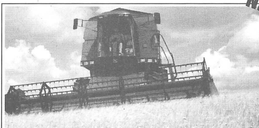
5 neue Hangmähdröser 5 neue Flächenmähdröser