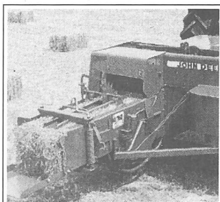
4 Reckteckballenpressen für problemloses Pressen